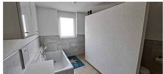
Die Wand im Badezimmer versteckt die Toilette und die Dusche.