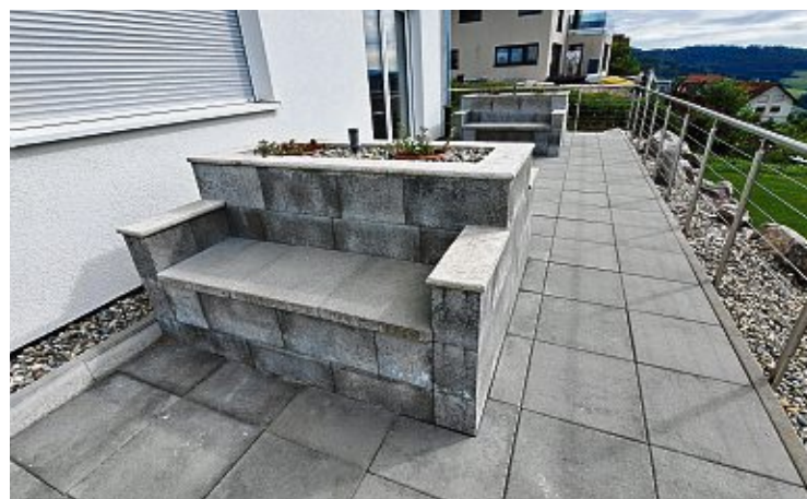
Auf der großen Terrasse sind auch insgesamt vier Sitzbänke entstanden.