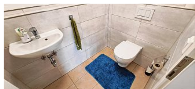
Die Gästetoilette in der Wohnung der Familie.