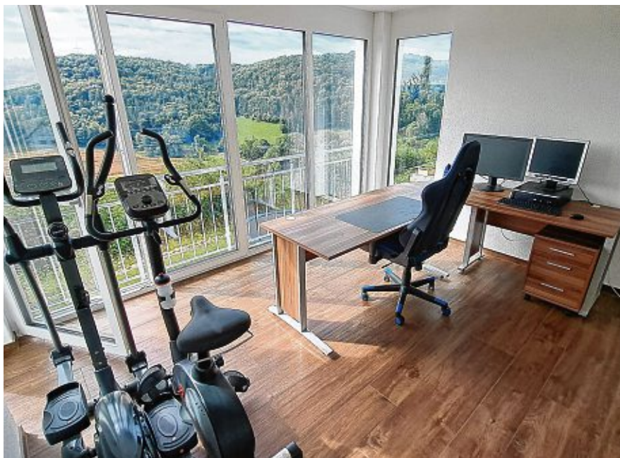
Der kleine Wintergarten wird primär zum Basteln, Spielen oder für die Hausaufgaben genutzt.

Hinten durch einen kleinen Flur befinden sich die beiden Kinderzimmer, das Elternschlafzimmer sowie eine Gästetoilette und das Familien-Badezimmer.