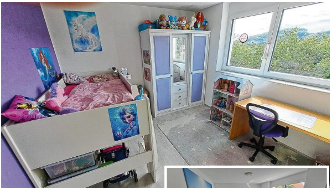
Der Mädchentraum in violett.