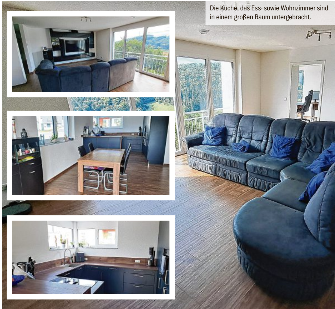
Die Küche, das Ess- sowie Wohnzimmer sind in einem großen Raum untergebracht.