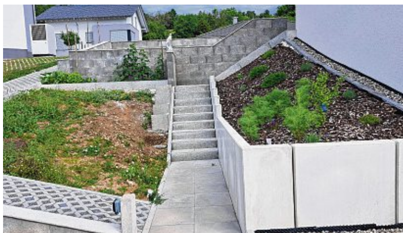
In den Beeten hat die Familie Basler Kräuter und Beeren gepflanzt.